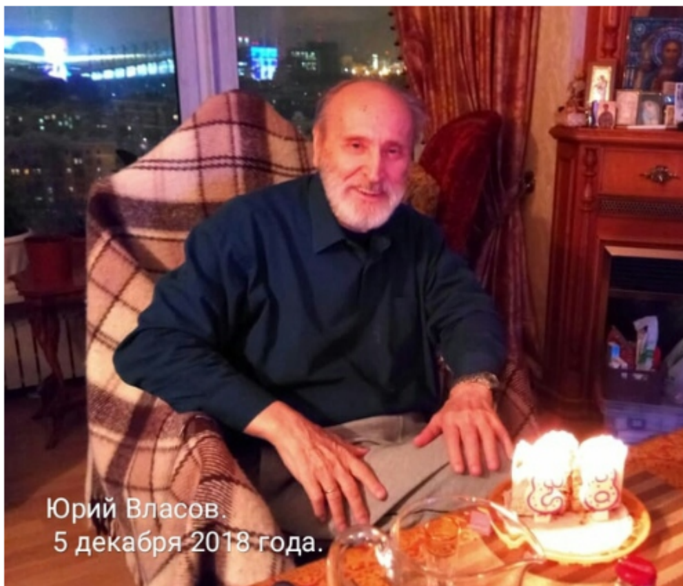
Юрий Власов. 5 декабря 2018 года.

Примечание :фото Юрия Власова сделано вчера.